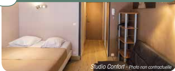
Studio Confort - Photo non contractuelle