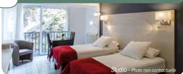
Studio - Photo non contractuelle